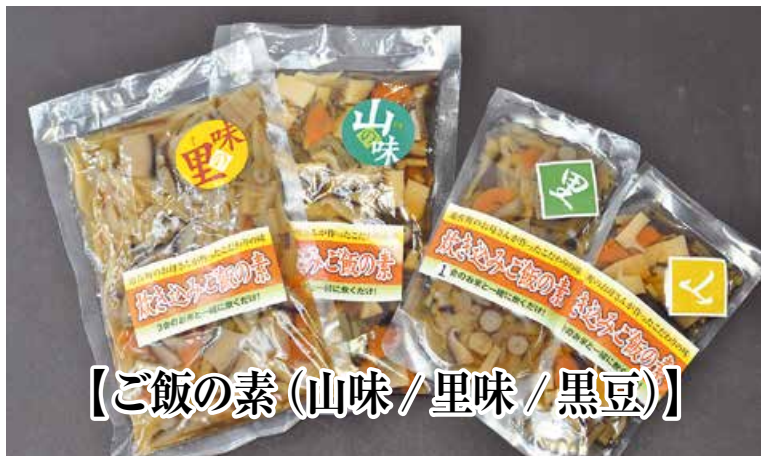
【ご飯の素(山味/里味/黒豆)】

忙しい家庭の味方でもありました。ぜひ肌から、お腹の中から、日々遊佐の恵みを体感してください。