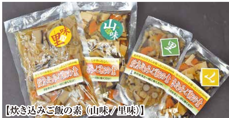
【炊き込みご飯の素 (山味/里味)】

忙しい家庭の味方でもありません。ぜひ肌から、お腹の中から、日々遊佐の恵みを体感してください。